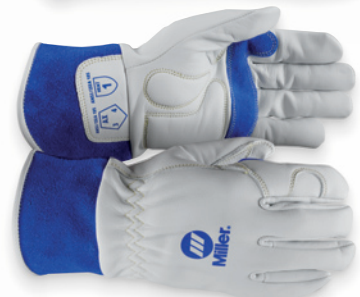
Guantes para TIG