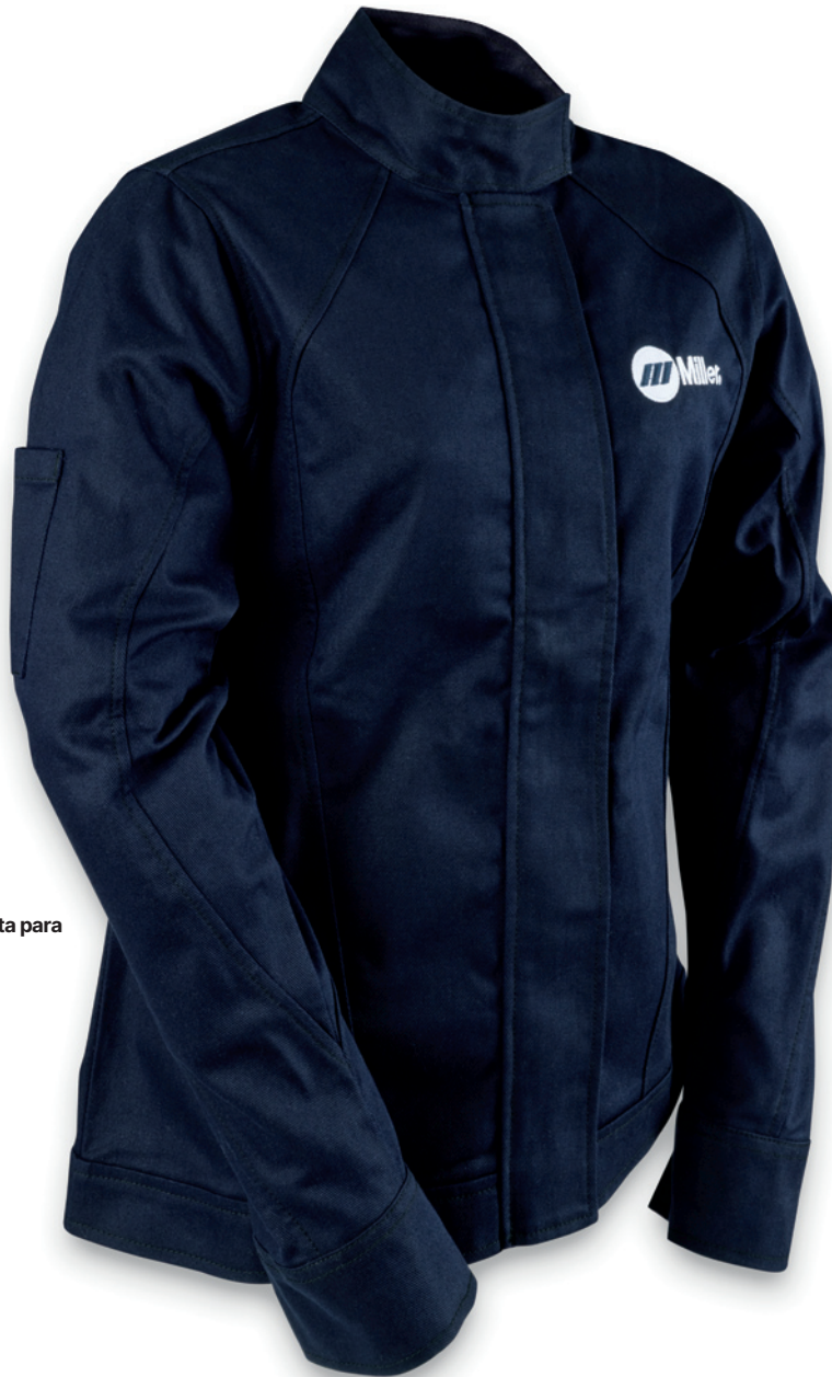
Chaqueta para soldar

Las chaquetas y los guantes de mujer Miller están diseñados para entornos de soldadura industrial. La hechura y los materiales de calidad se combinan para un ajuste ideal que alienta a las soldadoras a mantener sus equipos de protección personal (EPP) puestos, aumentando el cumplimiento y el rendimiento.