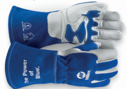
Guantes para MIG