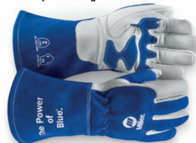
Gants pour soudage MIG