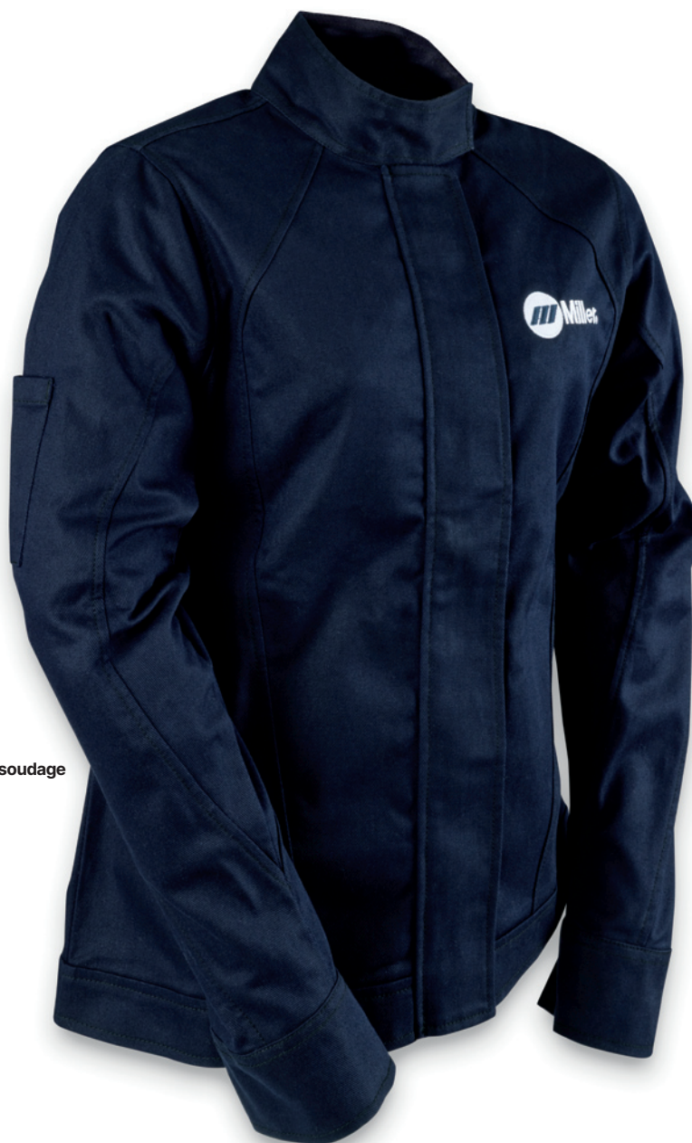
Veste de soudage

Les vestes et les gants pour femmes Miller sont conçus pour fonctionner dans des environnements de soudage industriels. La qualité de la confection et celle des matériaux utilisés se combinent pour un ajustement idéal qui encourage les soudeuses à continuer de porter leur équipement de protection individuelle (ÉPI), augmentant ainsi la conformité et la performance.