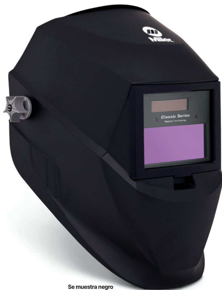
Se muestra negro (VS) 287803.