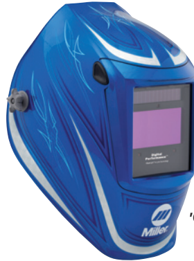
'64 Custom™ 296751