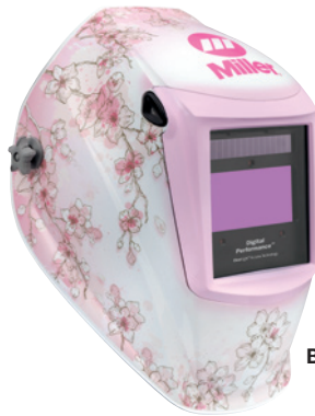
Burn & Blossom™ 296756