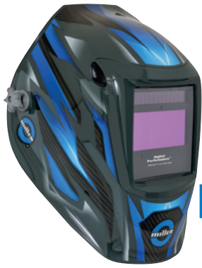
¡NUEVO! Carbon Edge™ 299616