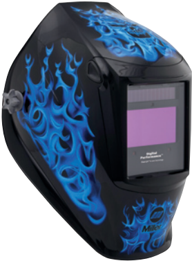
Blue Rage™ 296753