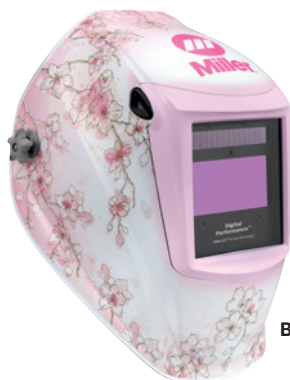
Burn & Blossom™ 296756