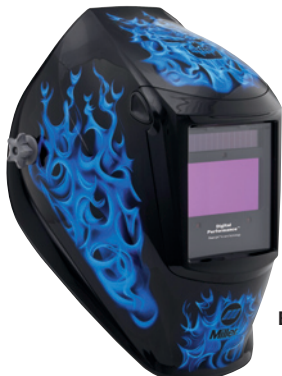
Blue Rage™ 296753