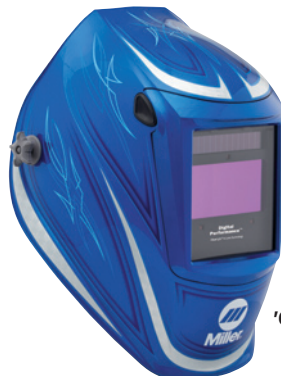
'64 Custom™ 296751