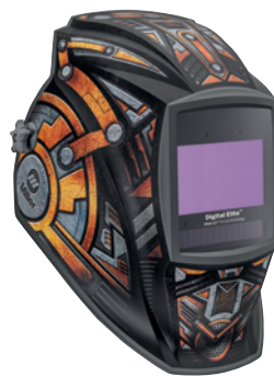
Gear Box™ 296771