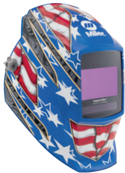
Stars and Stripes™ III 296770