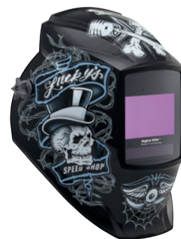
Lucky's Speed Shop™ 296766