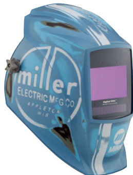
Vintage Roadster™ 296768