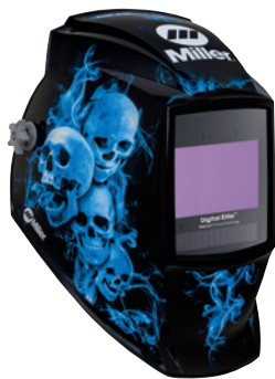
Blue Rage™ II 296774