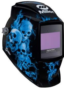
Blue Rage™ II 296774