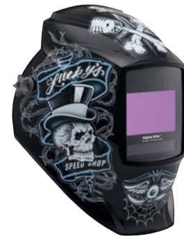
Lucky's Speed Shop™ 296766