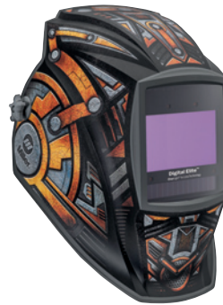
Gear Box™ 296771