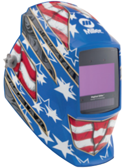
Stars and Stripes™ III 296770