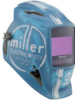
Vintage Roadster™ 296768