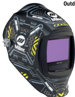
Black Ops™ 296779