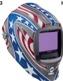
Stars and Stripes™ 296780